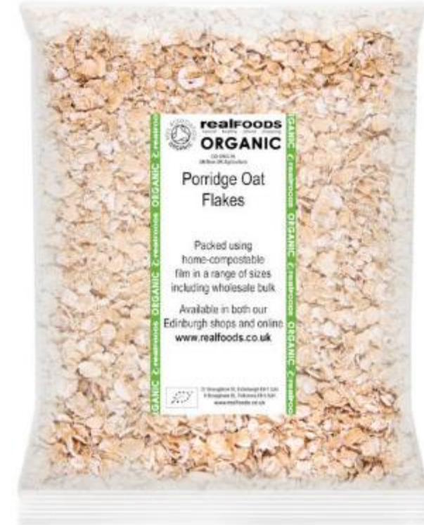
Organic Porridge Oat Flakes ingredients: Organic Porridge OAT Flakes.

INGREDIENTS: CEREAL (RICE, WHOLE GRAIN WHEAT, SUGAR, WHEAT BRAN, SOLUBLE WHEAT FIBER, SALT, MALT FLAVORING, MALTODEXTRIN, VITAMIN B 1 [THIAMIN MONONITRATE], VITAMIN B 2 [RIBOFLAVIN]), CORN SYRUP, SOLUBLE CORN FIBER, FRUCTOSE, STRAWBERRY FLAVORED FRUIT PIECES (SUGAR, CRANBERRIES, CITRIC ACID, NATURAL STRAWBERRY FLAVOR WITH OTHER NATURAL FLAVORS, ELDERBERRY JUICE CONCENTRATE FOR COLOR, SUNFLOWER OIL), SUGAR, VEGETABLE OIL (SOYBEAN AND PALM OIL WITH TBHQ FOR FRESHNESS, PARTIALLY HYDROGENATED PALM KERNEL OIL), MALTODEXTRIN, CONTAINS 2% OR LESS OF DEXTROSE, SORBITOL, GLYCERIN, NONFAT MILK, NATURAL AND ARTIFICIAL STRAWBERRY FLAVOR, SOY LECITHIN, SALT, NATURAL AND ARTIFICIAL FLAVOR, NIACINAMIDE, COLOR ADDED, VITAMIN B 6 (PYRIDOXINE HYDROCHLORIDE), BHT (PRESERVATIVE).